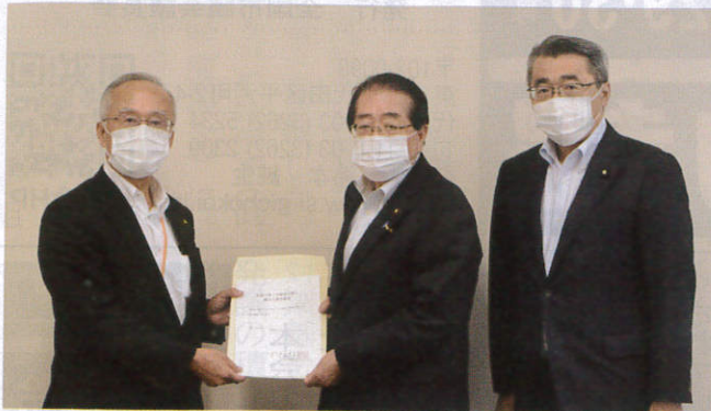
石田公明党政務調査会長(中央) 宮崎勝同党令和2年7月豪雨災害対策本部事務局長(右)