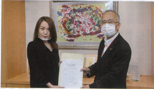
今井内閣府大臣政務官(左)