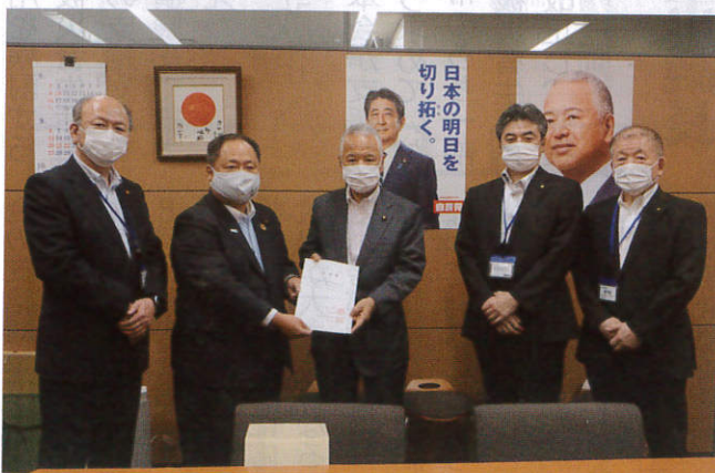
甘利自民党税制調査会長(中央)