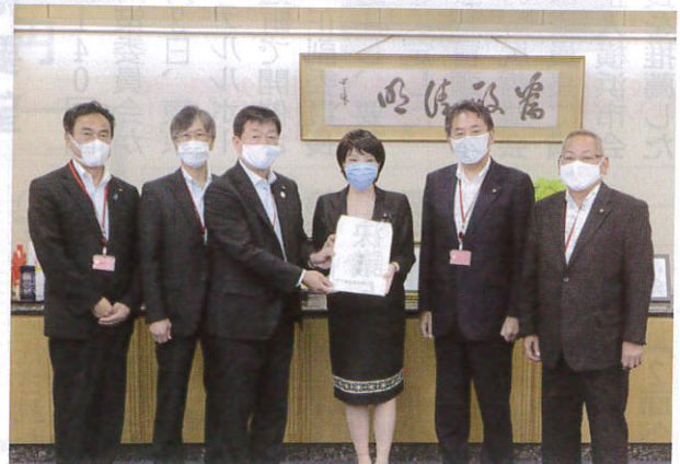
高市総務大臣(右から3人目)